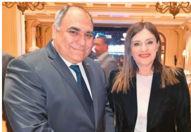
Ο πρόεδρος της Κύπρου Σταύρος Αυγουσιδής με την υφυπουργό Ναυτιλίας της Κύπρου Μαρίνα Χατζημανώλη

Από κυπριακής πλευράς ήταν η υφυπουργός Ναυτιλίας Μαρίνα Χατζημανώλη ,