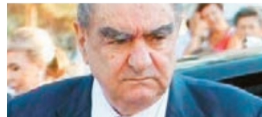
Οικ. Βαρδιογιάννη 31 τάνκερ