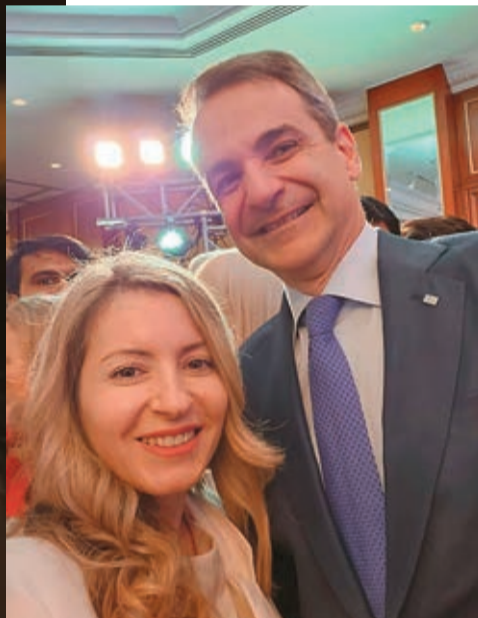
Με τον Κυριάκο Μητσοιάκη

της «50 πιο σημαντικές γυναίκες entrepreneurs του Ηνωμένου Βασιλείου»