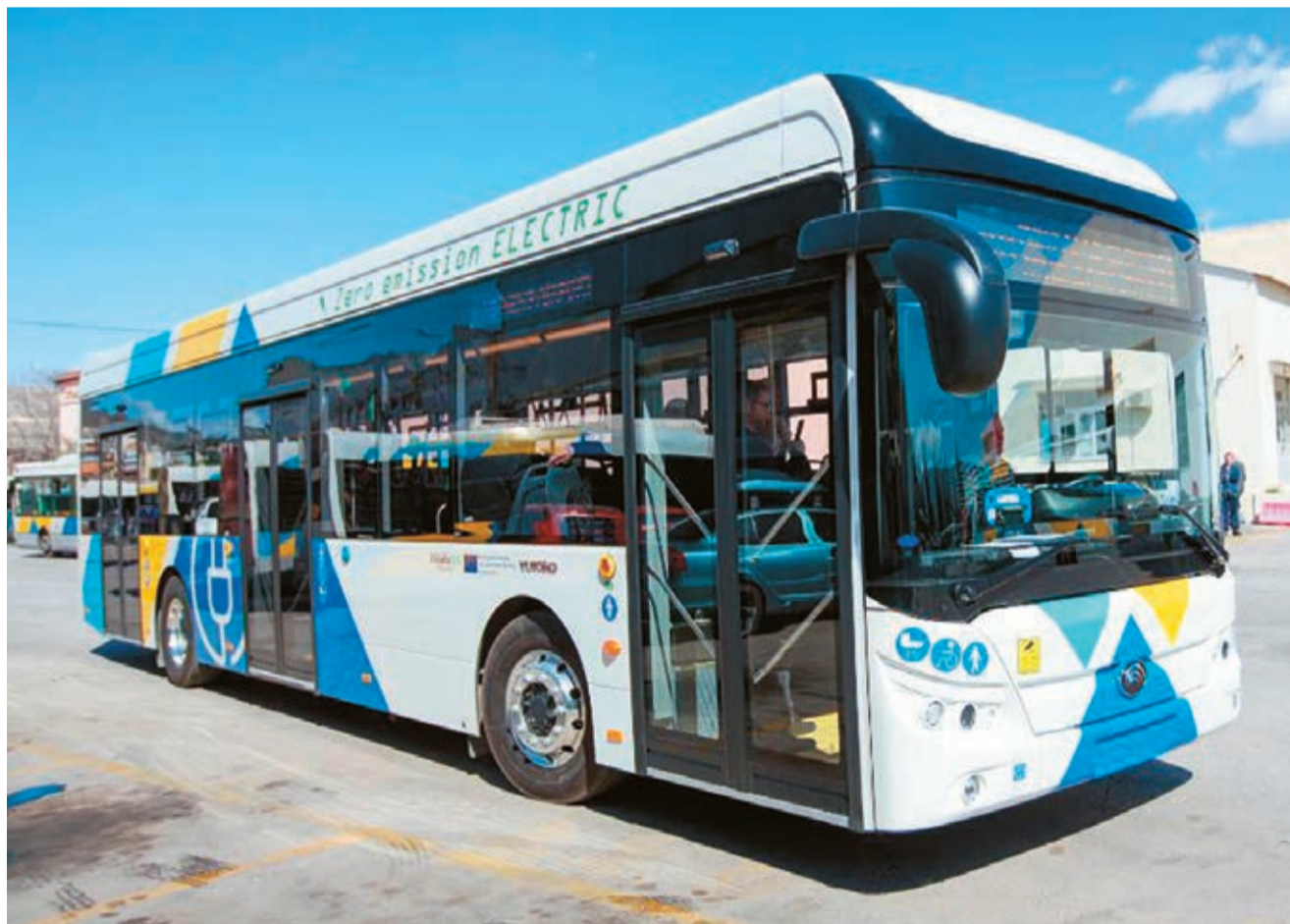
Ο κόσμος επιστρέφει στις αστικές συγκοινωνίες - Αύξηση εισπράξεων έως 15% το α' δίμηνο του έτους

- Ξεκινά εντός Απριλίου η πληρωμή εισιτηρίου με πιστωτική κάρτα στη γραμμή του αεροδρομίου - Τέλος του χρόνου και στο υπόλοιπο δίκτυο