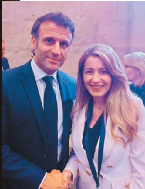
Με τον Εμανουέλ Μακρόν